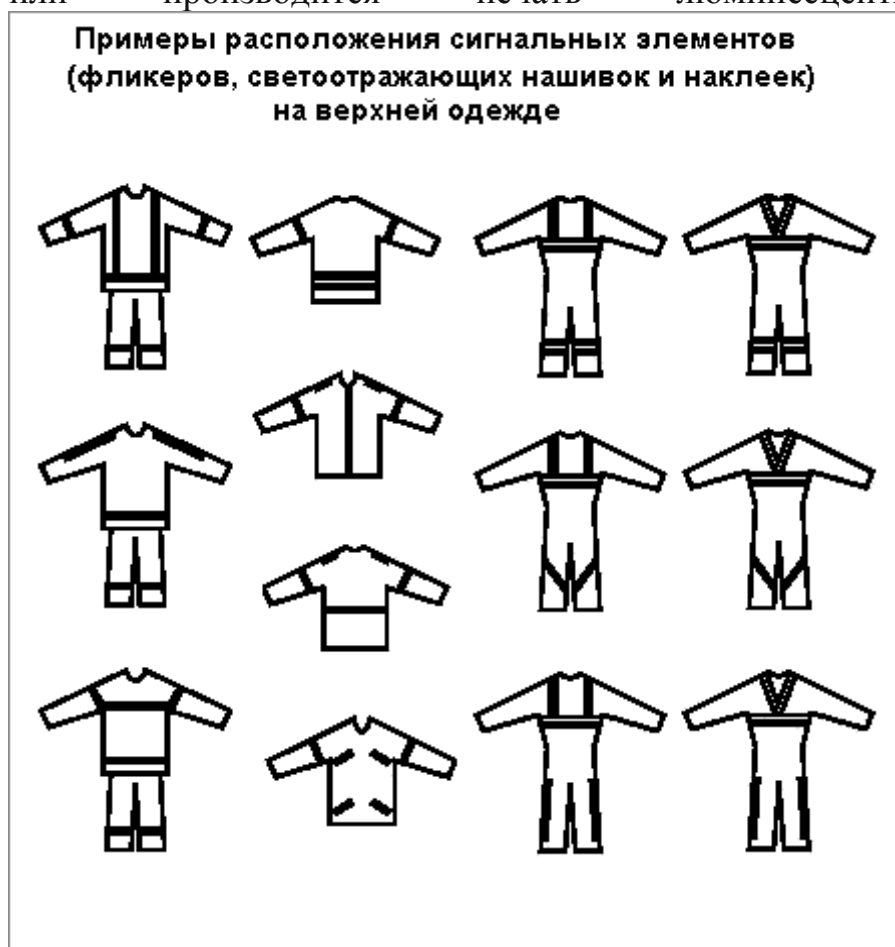
Рис.1. Примеры расположения сигнальных элементов (фликеров, светоотражающих нашивок и наклеек / лайтскотча) на верхней одежде.

Стандартная ширина световозвращающих лент, пригодных для самостоятельного оформления своих вещей, одежды - 12, 25 и 50 миллиметров. На слабо освещённой улице - поможет и самодельный фликкер, из подручных материалов, например, белый лист обычной писчей или глянцевой бумаги, поднятый повыше (чтобы было видно с любой стороны), сумка поярче или цветастый целофановый пакет, посветлее. При наличии и возможности, на сигнальные поверхности, заранее наносится световозвращающая краска-спрей (из баллончиков), самоклеющаяся плёнка или производится печать люминесцентным красителем.