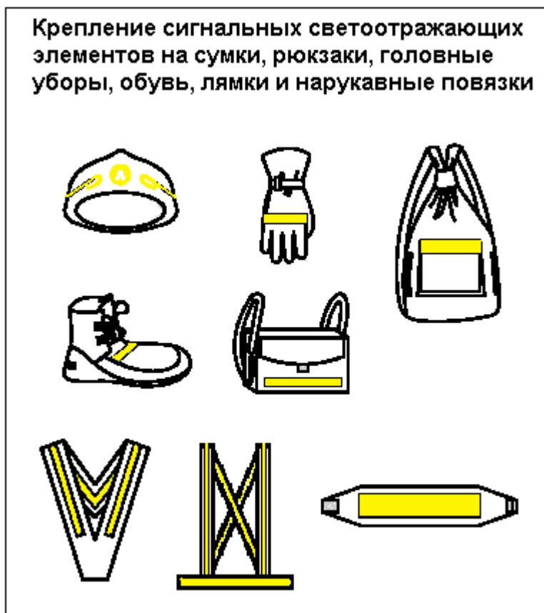
Рис.2. Крепление сигнальных светоотражающих элементов на сумки, рюкзаки, головные уборы, обувь, лямки и нарукавные повязки.