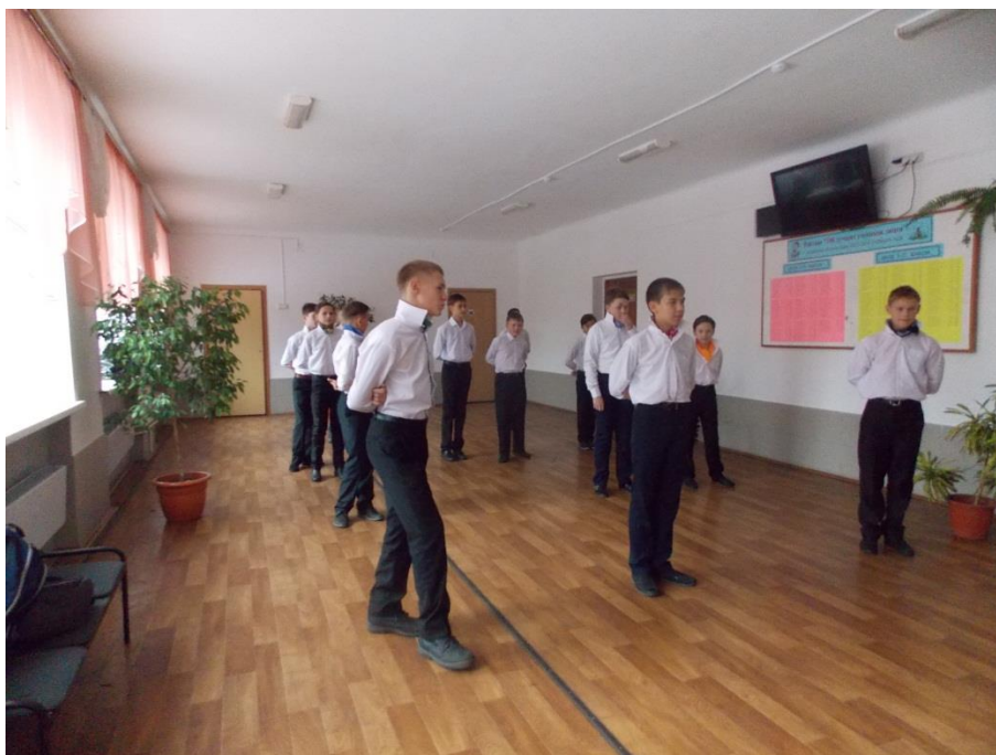
Урок танцев у юношей. Азы вальса