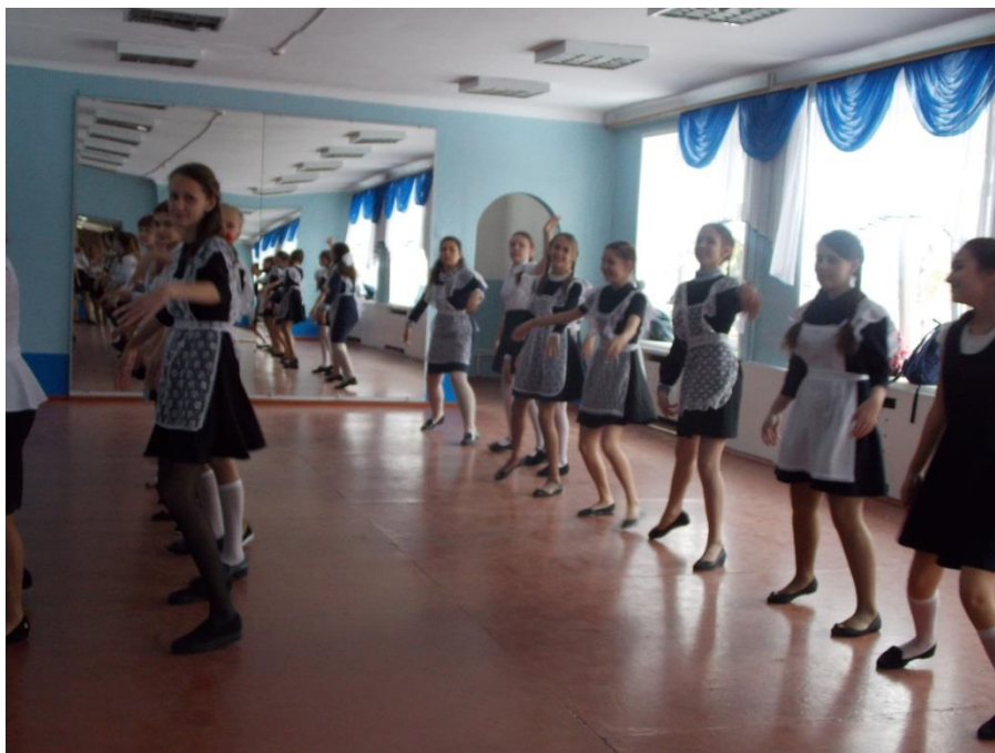
Урок хореографии у девушек - семиклассниц

Для девушек прошли следующие уроки: хореография, «уездной барышни альбом», риторика, этикет.